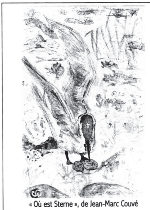
« Où est Sterne », de Jean-Marc Couvé

(L'heure H s'entend pétante la « non présentation » promise à rime en on )