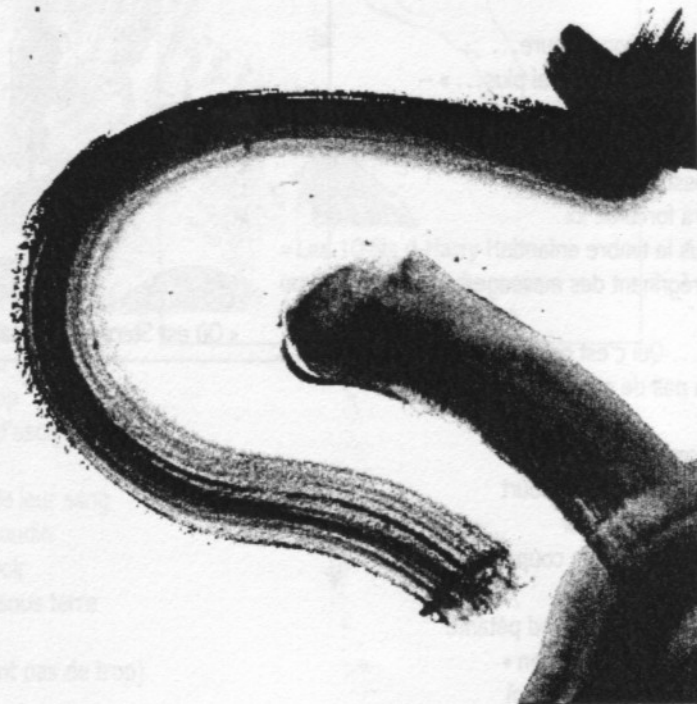
Illustration : Jean-Louis Millet